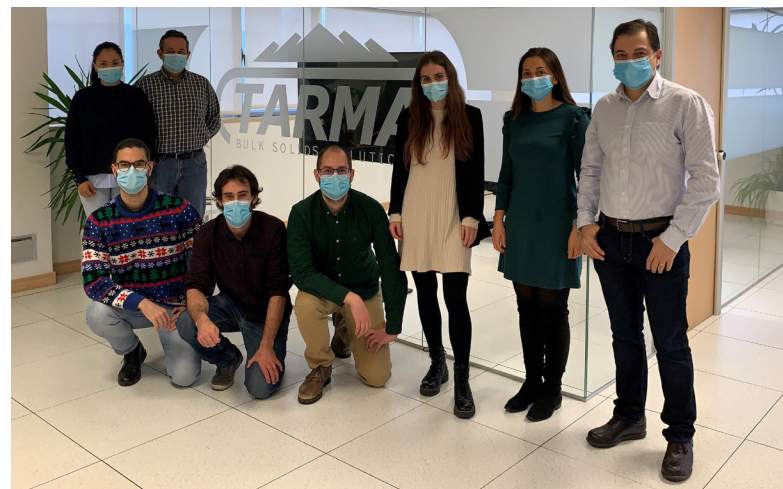
El equipo TarmaBulk